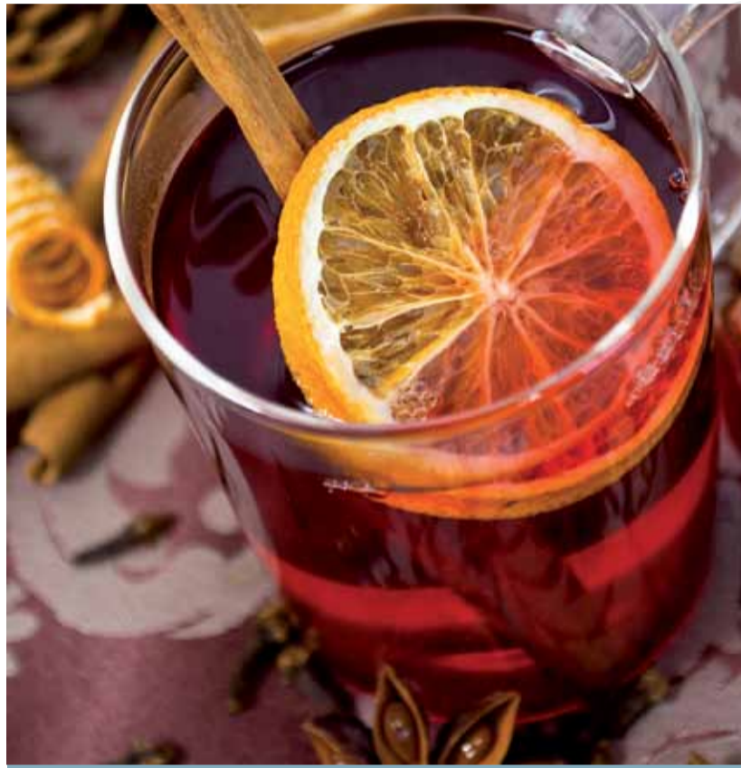
Sternanis und Zimtstangen - die klassischen Gewürze des Winters

empfinden sich zum größten Teil in der Nase über den Rachenraum abspielt. Die Aromen erwärmen sich im Mund, werden flüchtig und gelangen über den Rachenraum in die Nase an unser Riechzentrum, um hier wahrgenommen und geordnet zu werden. Wir sind in der Lage bis zu 600 verschiedene Düfte zu unterscheiden. Unsere Zunge dagegen ist beschränkt nur salzig, süß, bitter und sauer zu schmecken. Wer das nicht glaubt, versuche bitte mal ein Zucker-Zimt Gemisch mit fest zugehaltener Nase zu erkennen. Es bleibt nur süß, erst wenn Sie die Nase wieder öffnen, werden sie den Zimt erschmecken bzw. riechen. Doch sie schmeicheln nicht nur unserem Gaumen, sondern können auch unserem Körper gut tun und bei manchem helfen. Schon die erste deutsche Ärztin Hildegard von Bingen (12. Jhd.) wusste von der heilenden Wirkung mancher Gewürze. Heute lutschen wir Anisbonbons bei Halsweh, zahnende Babys kauen auf einer Nelkenwurzel. Andere Gewürze helfen der Verdauung oder gegen Schmerzen. Die heilenden Kräfte der Natur - helfen heute wie früher auch schon.