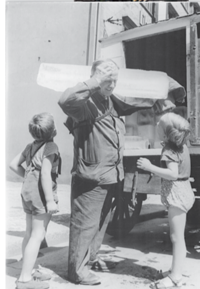
6. Juli 1957